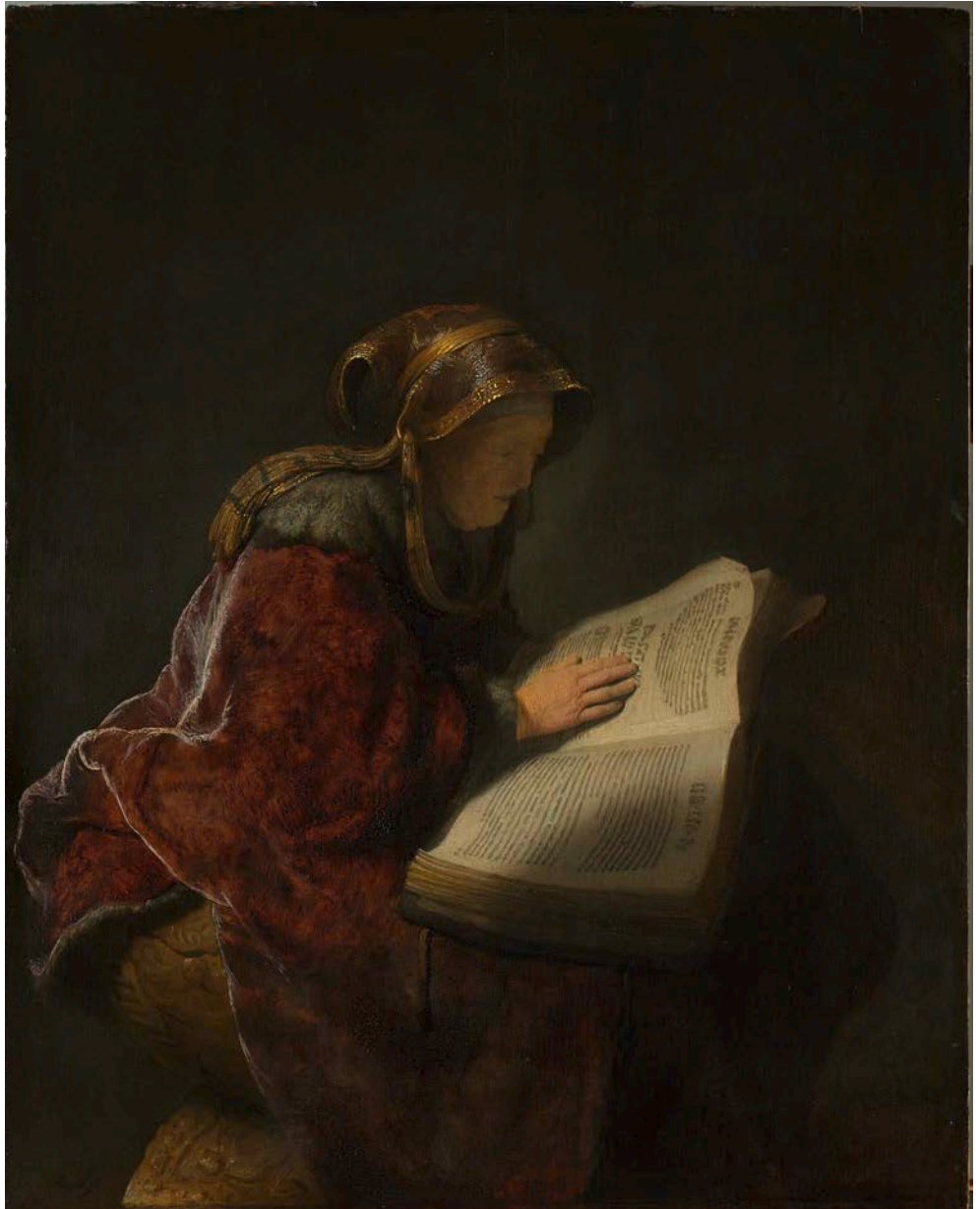
Afb. 25 Rembrandt van Rijn, Oude lezende vrouw , waarschijnlijk de profetes Hanna, 1631

Iedereen krijgt in het leven te maken met beperkingen, bijvoorbeeld door ouderdom. 'Ouderdom komt met gebreken' is niet voor niets een bekend Nederlands gezegde. Eigenlijk komen beperkingen, in meer of mindere mate, te allen tijde en overal ter wereld voor.