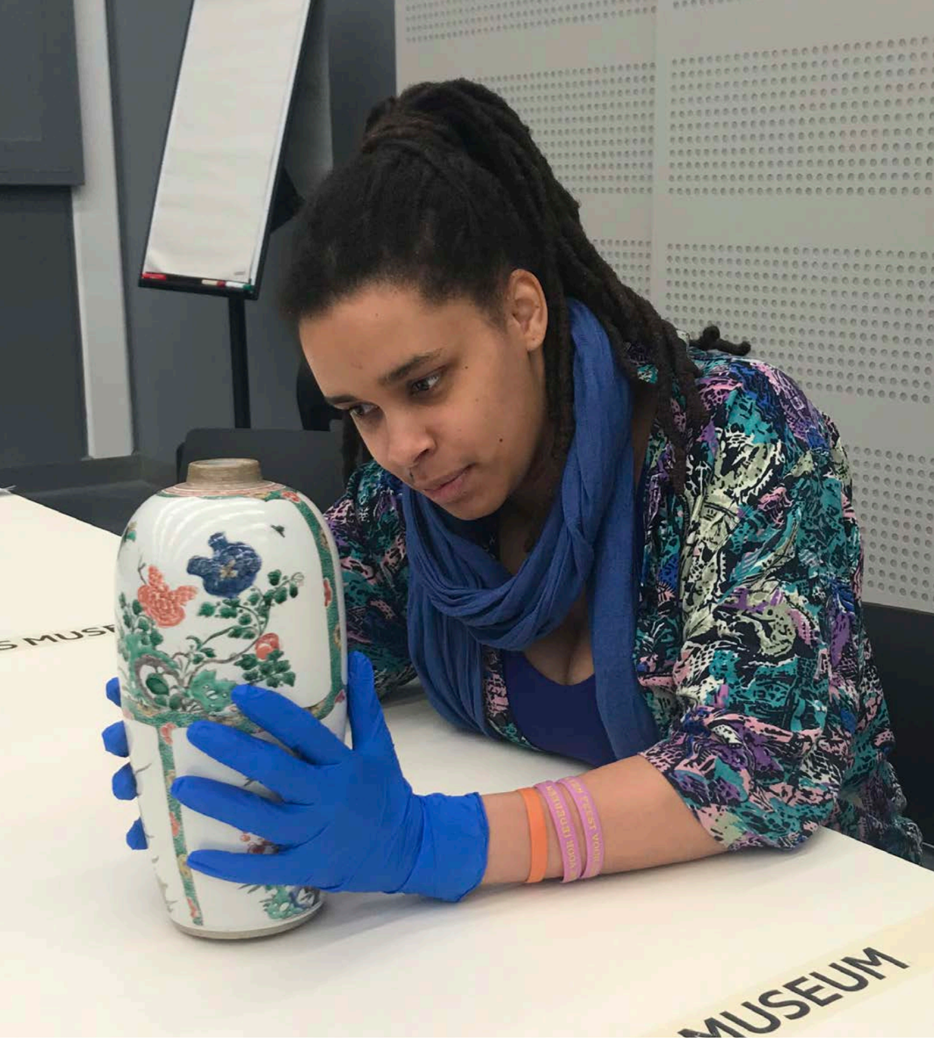
Afb. 11 Tastworkshop in CC NL