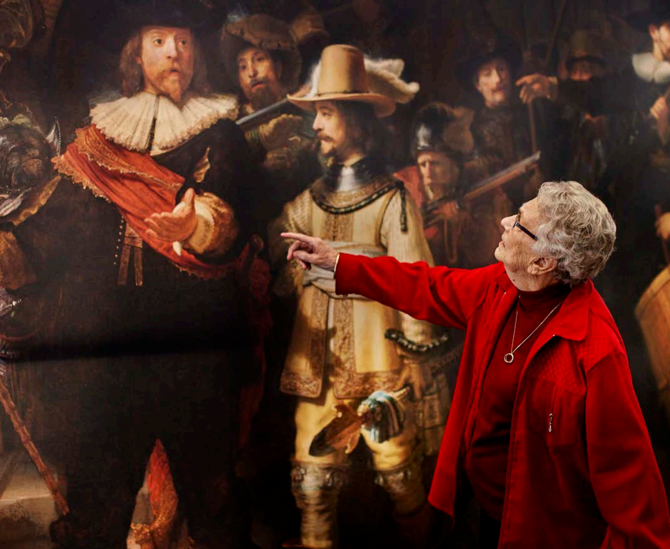
Afb. 26 Nachtwacht on Tour, waarbij een replica van De Nachtwacht naar verpleeghuizen gaat