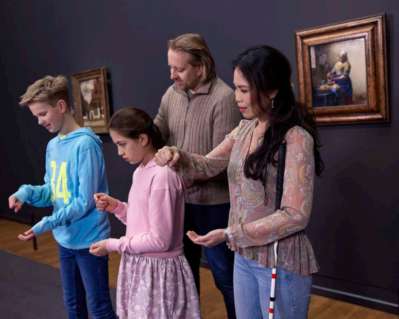
Afb. 3 Embodiment-opdracht bij de familierondleiding voor blinde en slechtziende mensen