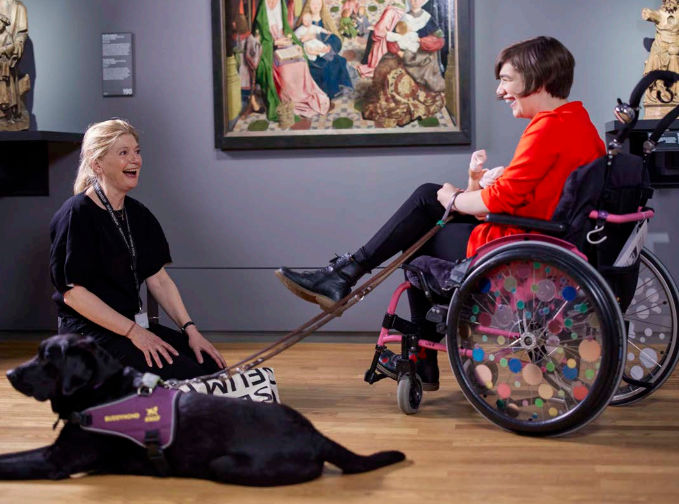
Afb. 12 Rondleiding voor families met kinderen met speciale behoeften