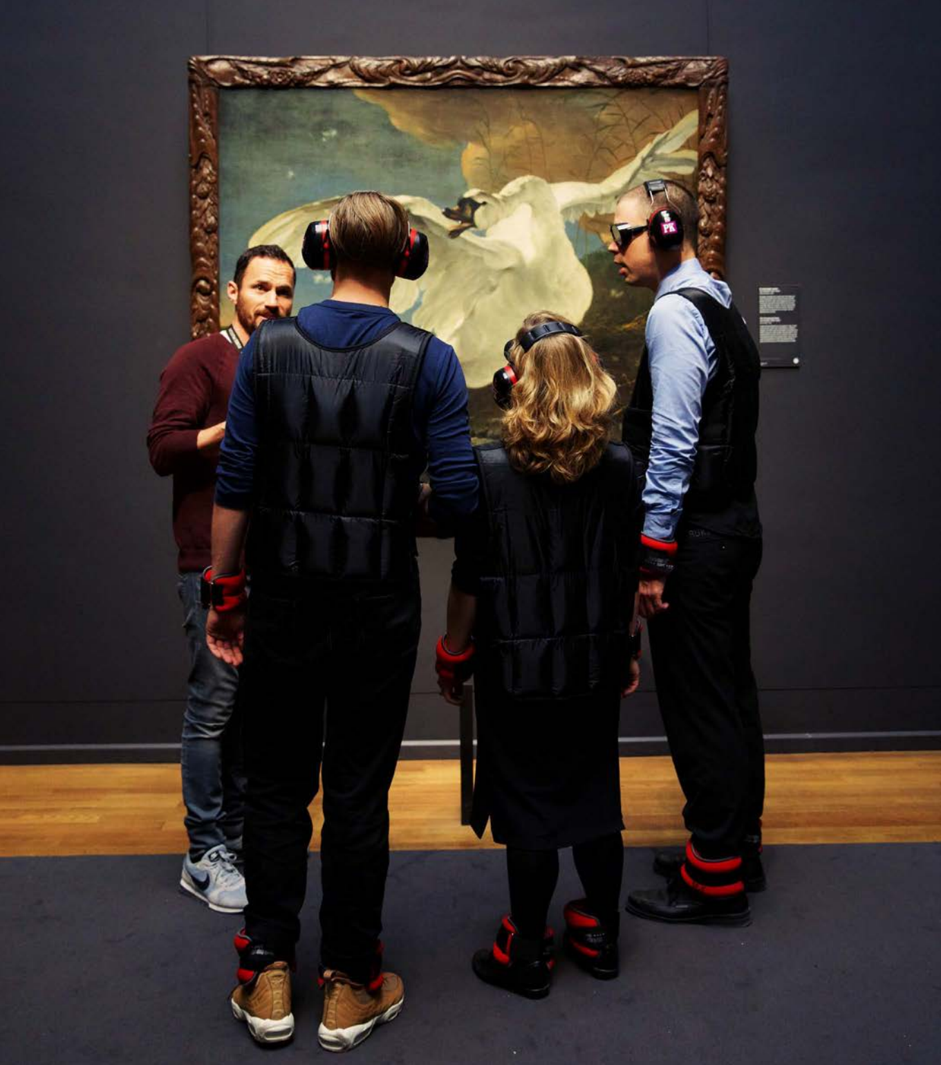
Afb. 10 Medewerkers van het Rijksmuseum krijgen een rondleiding in beperkingenpakken