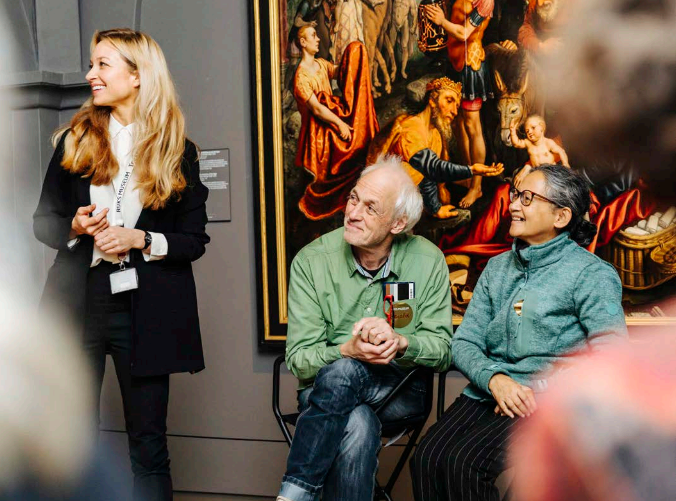
Afb. 13 Rondleiding voor mensen met dementie en hun dierbaren