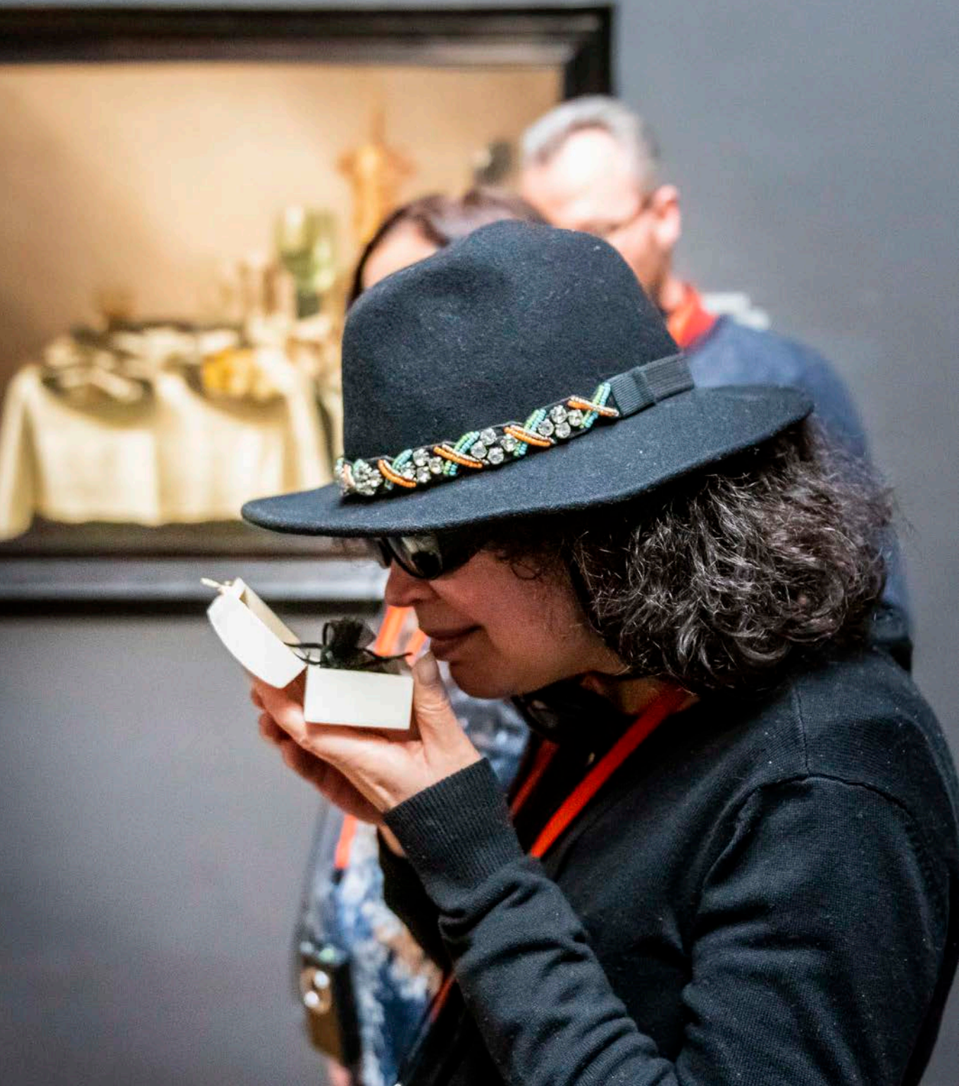
Afb. 9 Het inzetten van geur bij een schilderij