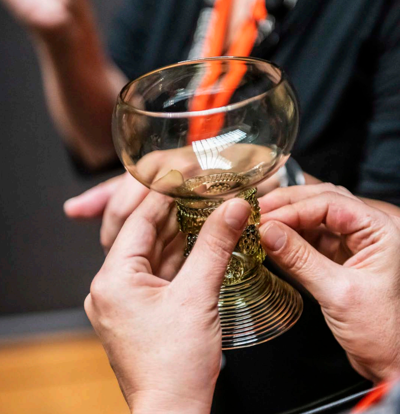
Afb. 7 Op 17de-eeuwse schilderijen van gedekte tafels is vaak een roemer (wijnglas) afgebeeld. Hier zitten noppen op om te voorkomen dat het glas uit je vettige handen gleeed. Voor de blinde of slechtziende museumbezoeker kan het voelen van dit glas een goede aanvulling op de rondleiding zijn, om zich beter te kunnen inleven