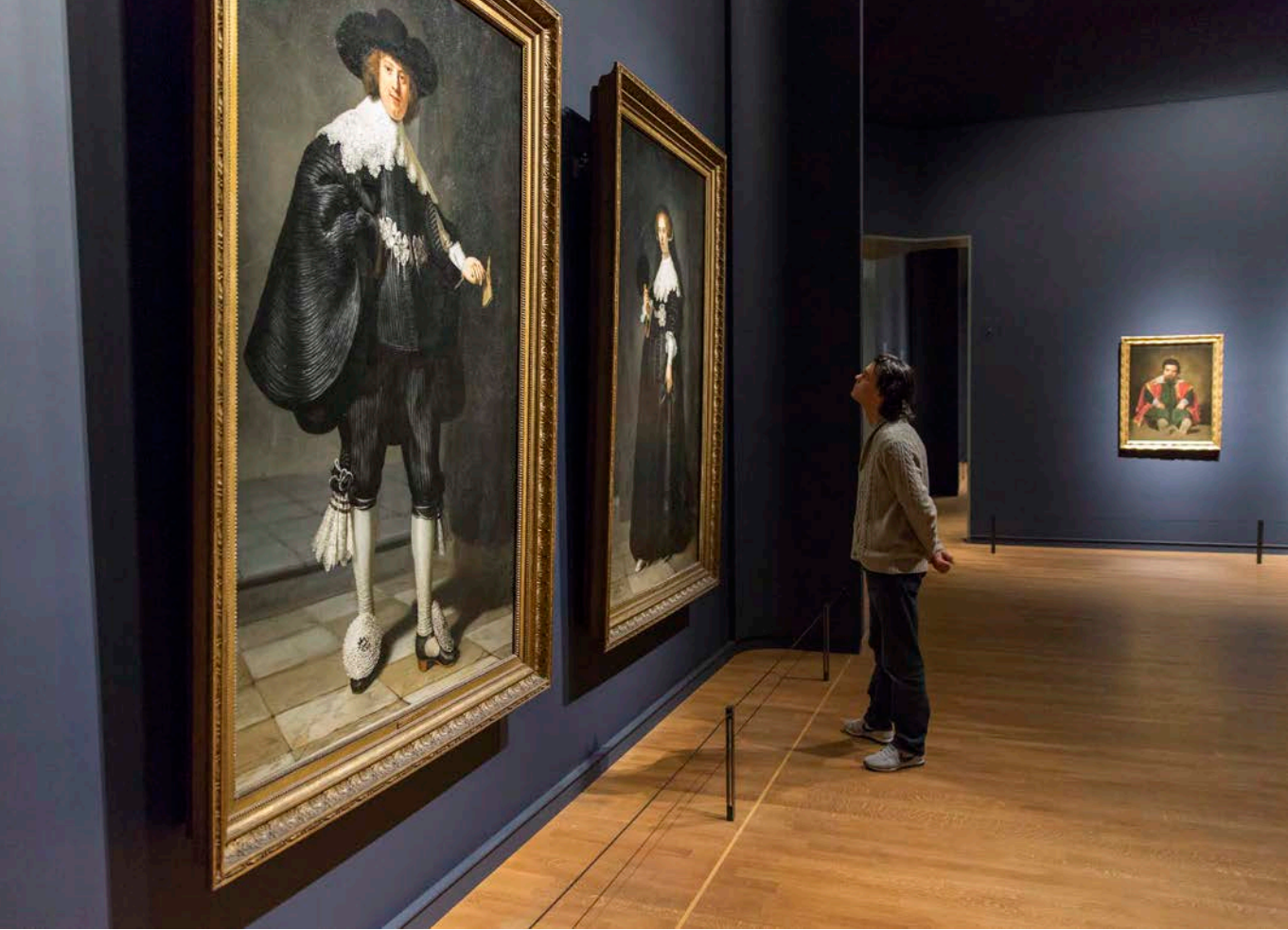
Afb. 14 Prikkelarme avondopenstelling