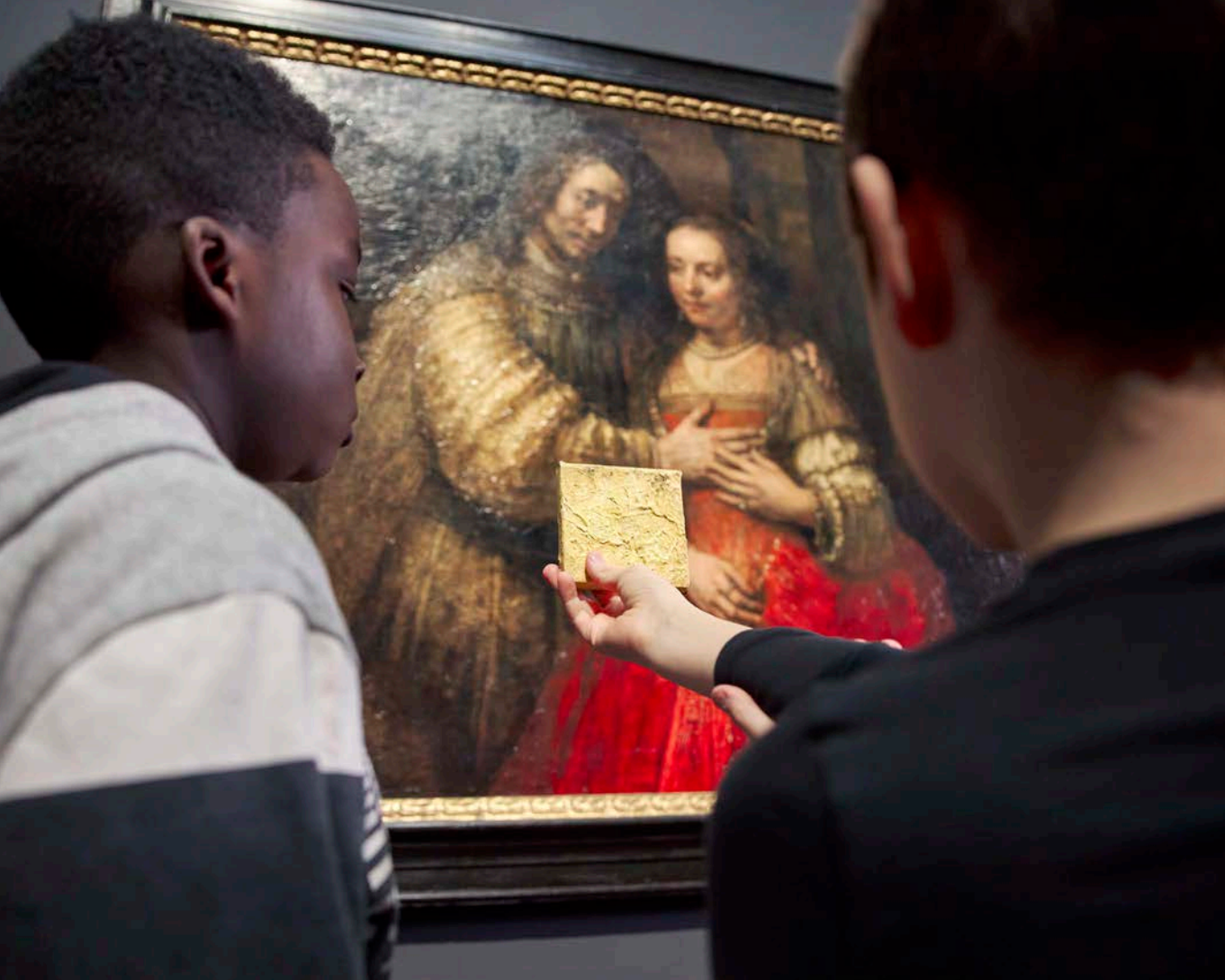
Afb. 5 In de rondleidingsmand zitten objecten om te bekijken, ruiken, voelen en proeven. Met dit plankje kunnen blinde en slechtziende mensen de grove verfstreek van Rembrandts Joodse bruidje voelen