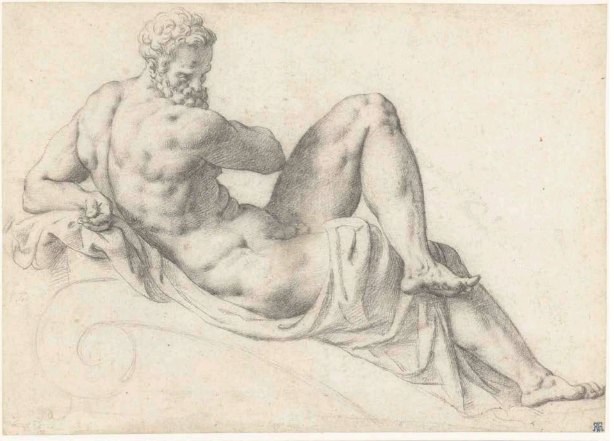
Afb. 23 Michelangelo, Personificatie van Dag , 1534

Had de bekende Italiaanse kunstenaar Michelangelo het autismespectrumstoornis? Geschriften over zijn interesses en activiteiten suggereren dat wel. Opmerkelijk is dat dit gedrag zijn reputatie en succes nooit negatief heeft beïnvloed.