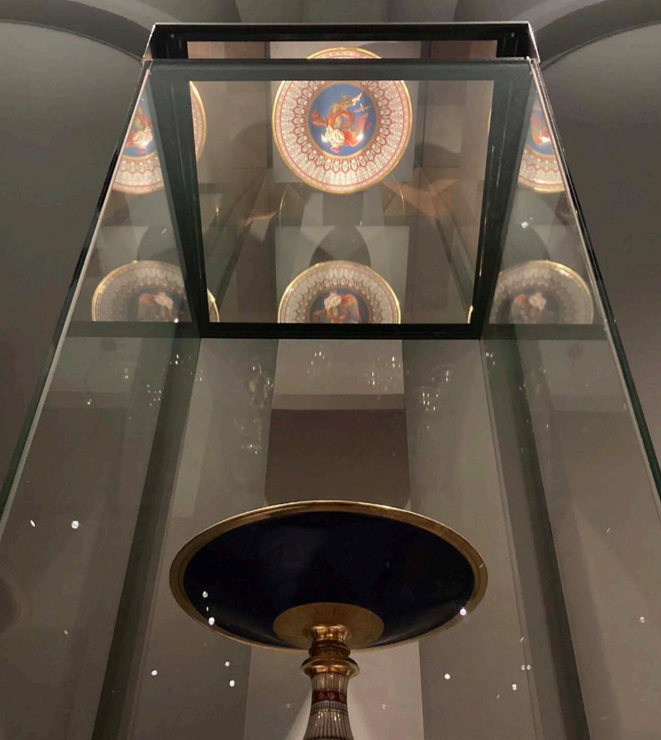
Afb. 15 Via de spiegel boven deze vaas kunnen ook mensen in rolstoel of kleine mensen de bovenkant van het kunstwerk zien