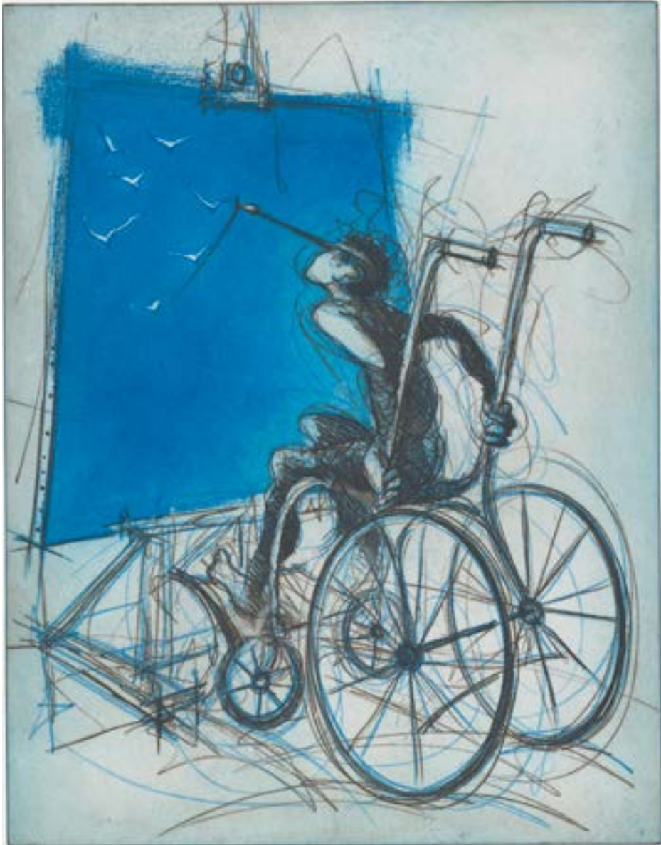
Afb. 20 Ronald Tolman, Schilderend in rolstoel , 1994

Hier zie je een kunstenaar in een rolstoel aan het werk, vogels schilderend met het penseel dat met een band aan zijn hoofd is vastgemaakt. Tolman haalde inspiratie uit kleur, opvallende perspectieven en personages. Dit werk past precies binnen zijn stijl.