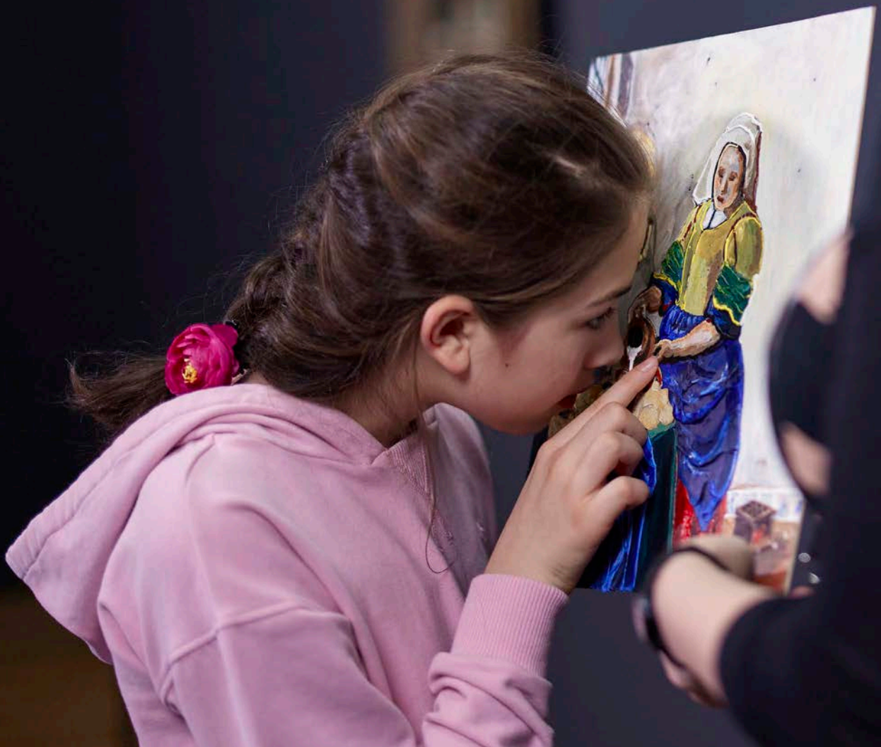
Afb. 4 Slechtiend meisje bestudeert het voelschilderij van Het melkmeisje