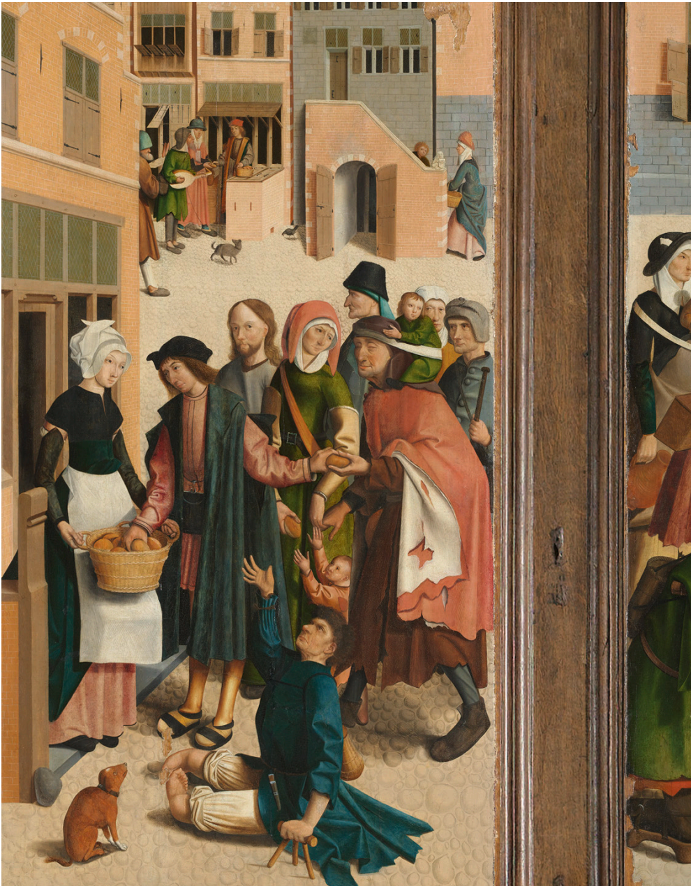
Afb. 18 Meester van Alkmaar, De zeven werken van barmhartigheid (detail), 1504 In de middeleeuwen werden mensen met beperkingen afgebeeld in de marge van de samenleving. En dan ook nog eens als bedelaar. Er waren in die tijd weinig andere mogelijkheden voor hen om geld te verdienen.