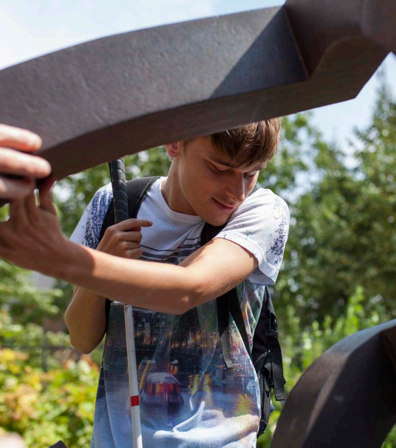
Afb. 8 Rondleiding voor blinde en slechtziende mensen in de tentoonstelling Eduardo Chillida in de Rijksmuseumtuinen , 2018