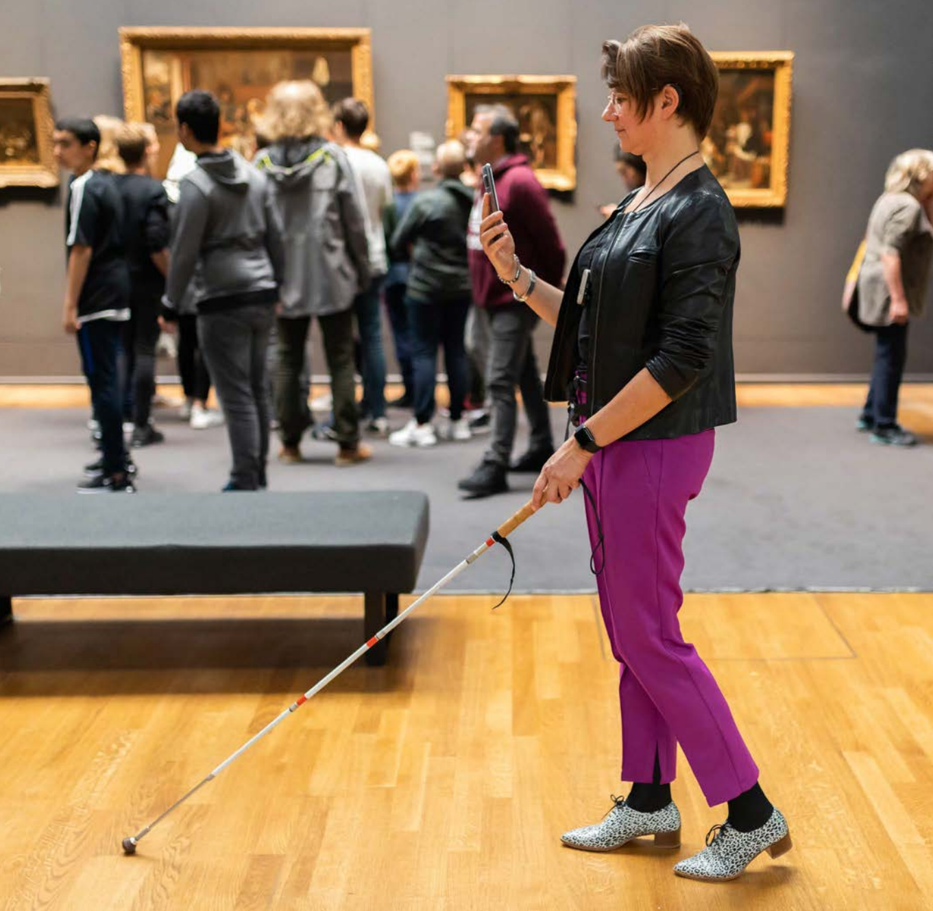
Afb. 16 De navigatie-app eZwayZ van Bartiméus wordt in het Rijksmuseum getest