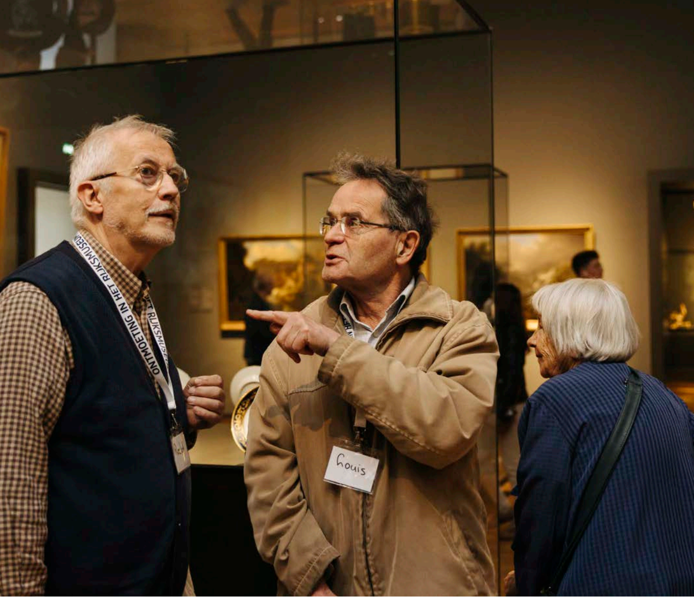
Afb. 28 Ontmoeting in het Rijksmuseum, een programma voor ouderen met eenzame gevoelens