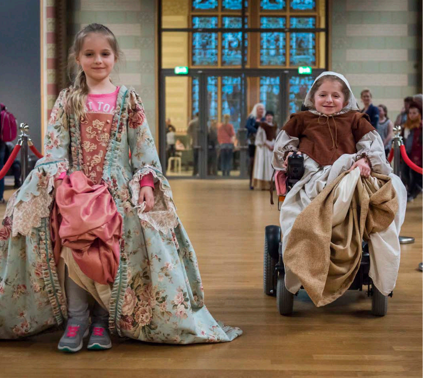
Afb. 27 Een keer per jaar organiseert het Rijksmuseum de Prachtnacht, een avond voor kinderen die door ziekte of beperking het museum niet tijdens de gewone openingstijden kunnen bezoeken. Op deze avond mogen ze hun hele familie meenemen