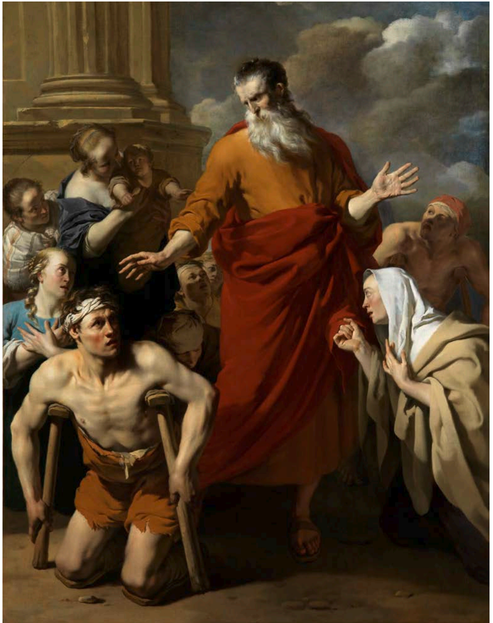
Afb. 17 Karel du Jardin, Paulus geneest de man die niet kon lopen , 1663 De voormalige titel van dit schilderij was: Paulus geneest de kreupele in Lystra . 'Kreupele' is een term die we vandaag de dag niet meer gebruiken om een persoon te beschrijven.