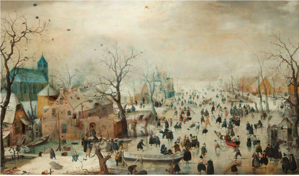
Afb. 24 Hendrick Avercamp, Winterlandschap met schaatsers , ca. 1608

Hendrick Avercamp was een Nederlandse 17de-eeuwse schilder die doof was. Hij maakte populaire winterse landschappen met daarop typisch Hollands vermaak. Af en toe verstopte hij daar een poepend figuurtje in, voor de tijdloze grijns.