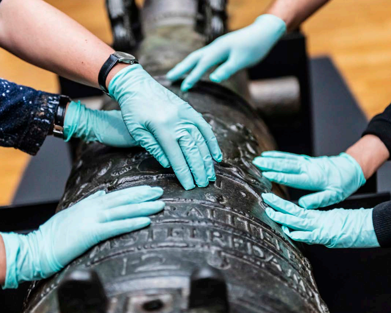
Afb. 6 Een kanon uit de 17de eeuw mag worden aangeraakt tijdens de rondleiding voor blinde en slechtziende mensen