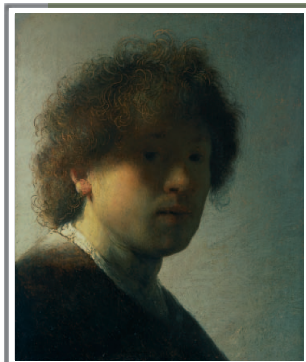
Zelfportret op jeugdige leeftijd Dit is Rembrandt op 22-jarige leeftijd. Hij schilderde zichzelf omdat dat goedkoop was: zo hoefde hij geen model te betalen. Zie hoe mooi het licht op de krullen valt, maar zijn gezicht is verscholen in het donker.