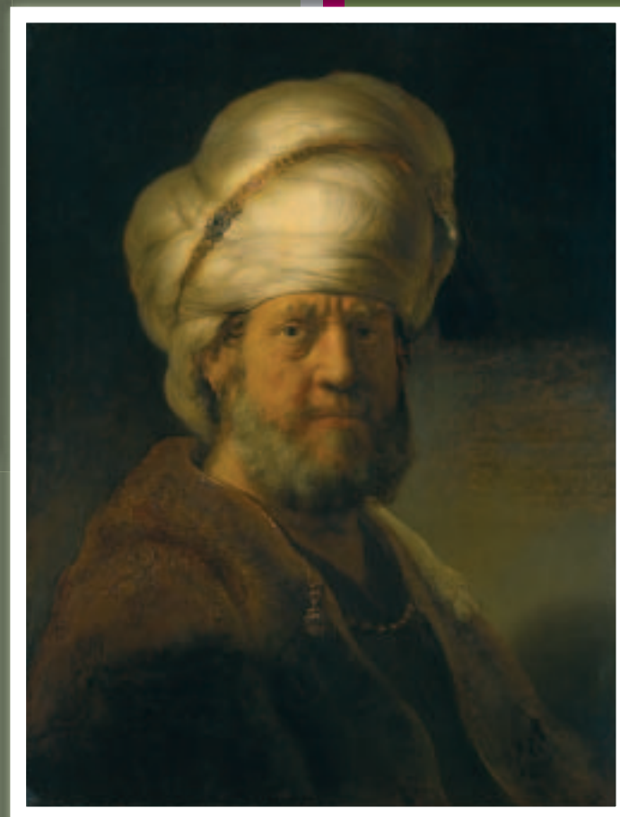
Een Oosterling Dit is een tronie: een afbeelding van een onbekende man in een fantasiekostuum. Rembrandt kon zijn fantasie loslaten op dit werk. Let op de parel aan de tulband en de glinsterende stukjes op de jas! Dé specialiteiten van Rembrandt.