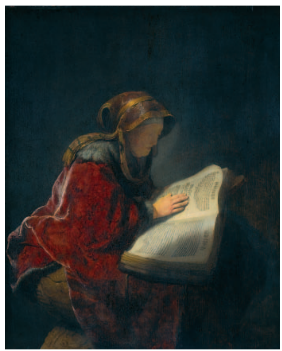
De profetes Anna Rembrandt was de zoon van een molenaar. Hij gebruikte zijn vader en moeder als model voor bijbelse voorstellingen en portretten. Hier zie je de moeder van Rembrandt als de profetes (bijbelse vrouw) Anna.