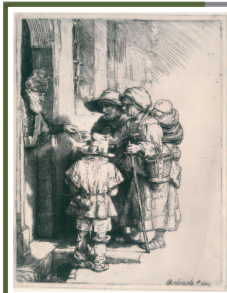
Drie vrouwen en een kind bij een deur Dit werk is niet getekend maar gedrukt. Deze techniek heet een ets. Je ziet bedelaars aan de deur bij een rijke man. Zelfs de baby op de rug kijkt hem nieuwsgierig aan.