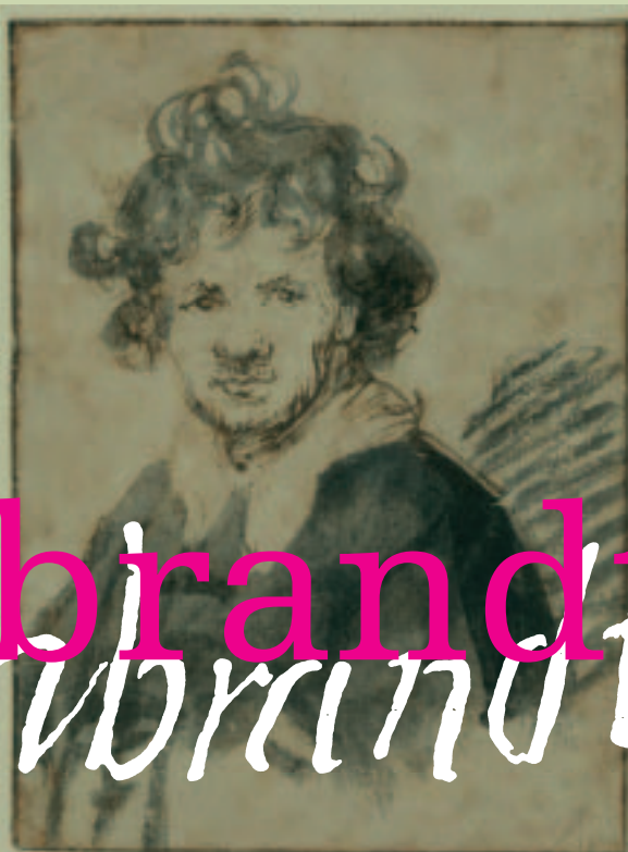
Zelfportret tekenend aan een venster Rembrandt zit aan het raam en werkt. Het kan zijn dat hij etst of tekent. Hij kijkt ons recht aan. Bijzonder is dat je ziet hoe hij werkt. Hij lijkt nét een echt mens.