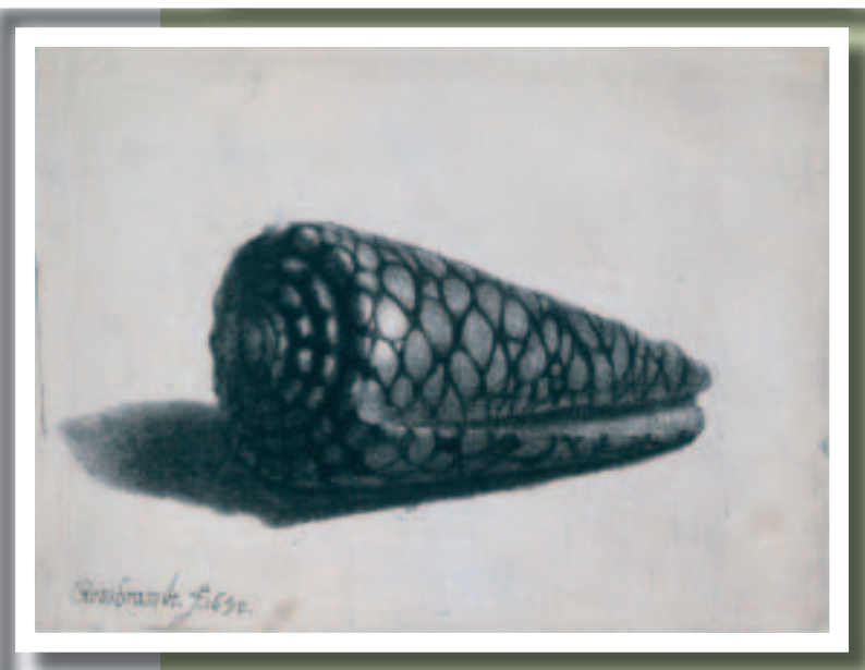
De schelp Dit is de enige prent met een voorwerp uit Rembrandts eigen verzameling. Rembrandt verzamelde kunst en voorwerpen. Deze gemarmerde kegelslak komt uit de Indische oceaan.