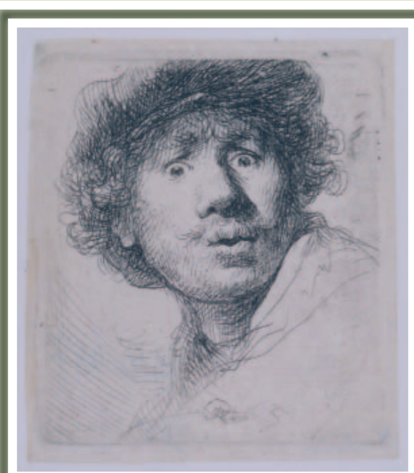
Zelfportret met baret en opengesperde ogen Op deze ets is Rembrandt 25 jaar. Hij kijkt verbaasd en het lijkt of hij ons iets wil zeggen. Wat zou er in hem omgaan?