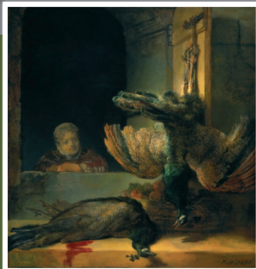
Stilleven met pauwen De pauwen zijn net dood: het bloed druppelt nog op de vensterbank. Het kopje van de ene pauw lijkt wel uit het doek te vallen. Het meisje kijkt uit het raam. Wat doet ze daar? Wie zou zij zijn?